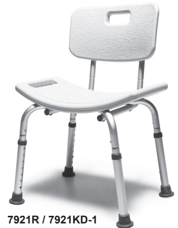
7921R / 7921KD-1