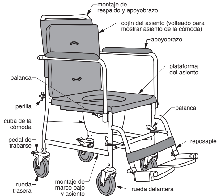
6810A Drop Arm VersaMode